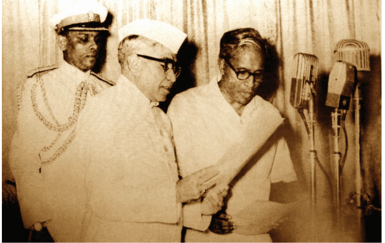
ഇ എം എസ് നമ്പൂതിരിപ്പാട് സത്യപ്രതിജ്ഞ ചെയ്തപ്പോൾ