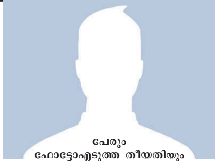
പേരും ഫോട്ടോ എടുത്ത തീയതിയും